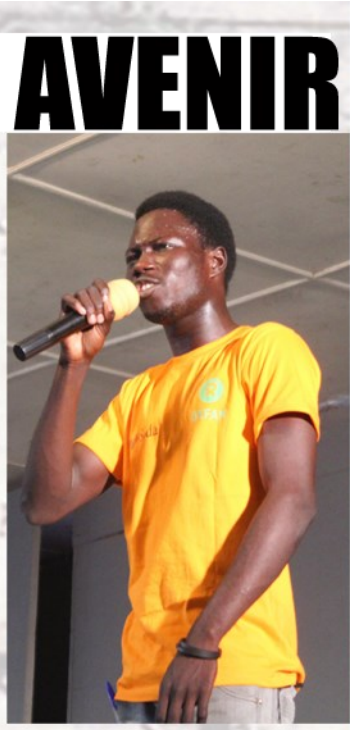
Interview réalisé par Nang-yanan Raoul

Les Echos de la Croix Bleue Tchadienne : Merci de votre temps accordé et surtout beaucoup de courage pour l'atteinte vos objectifs pour le bien être des jeunes au sein de votre campus Monsieur le Président.